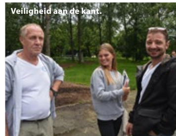
Veiligheid aan de kant.