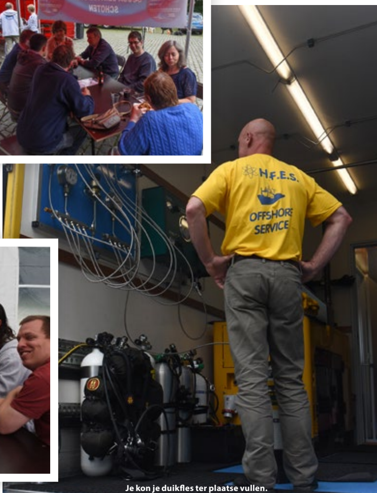
Je kon je duikfles ter plaatse vullen.