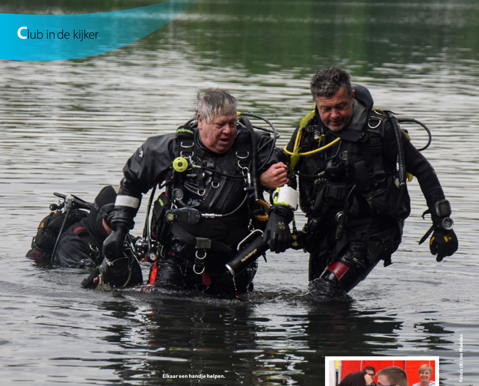
Elkaar een handje helpen.